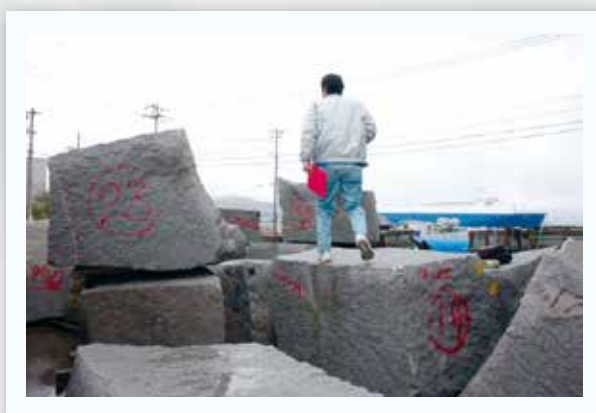
内垣石 A ランク原石は、お墓約 100 基分 !!

内垣石、天山石、大島石などの採掘場に直接出向き、石目、濃さ、難がないかなど厳しく検品しています。石材業界の言葉に「丁場（採掘場）は嘘をつかない」とよく言います。丁場は、正に現在の原石の状態がリアルタイムに分かる場所でもあります。妥協しないお墓作りは先ず採掘場からです！