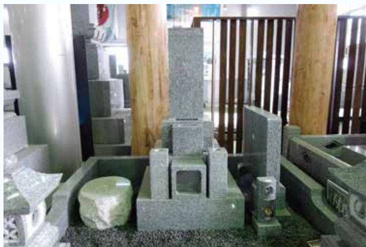
いづかオリジナル和墓 R型